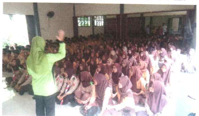
Sosialisasi Perda Nomor 4 Tahun 2021 dan Perda Nomor 2 Tahun 2016