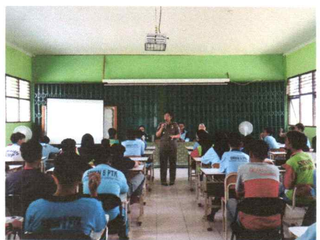
Sosialisasi Perda Nomor 4 Tahun 2021 dan Perda Nomor 2 Tahun 2016